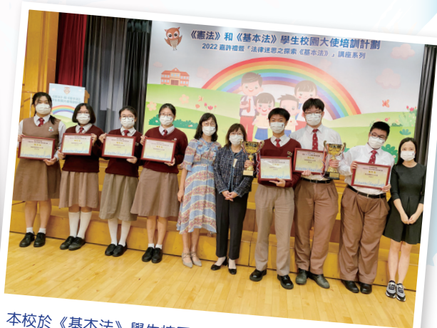
本校於《基本法》學生校園大使培訓計劃獲獎。翁校長親身出席嘉許禮，推動學生認識《憲法》及《基本法》