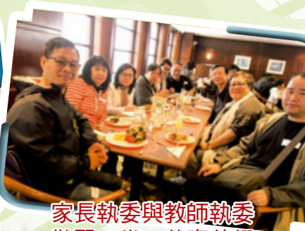
家長執委與教師執委 歡聚一堂，共享美饌