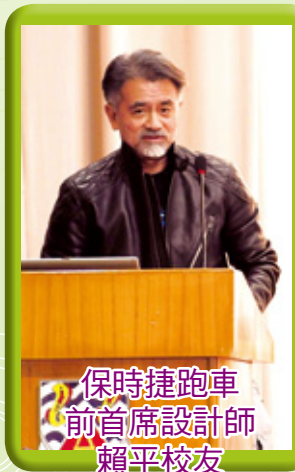
保時捷跑車 前首席設計師 賴平校友