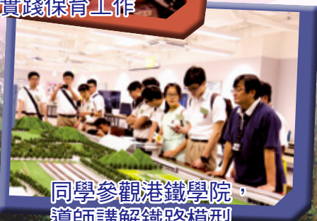
同學參觀港鐵學院， 導師講解鐵路模型