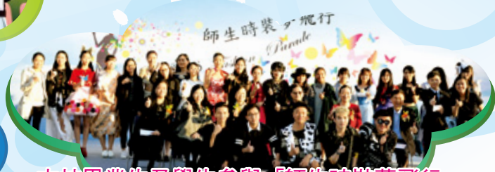
本校畢業生及學生參與「師生時裝夢飛行」