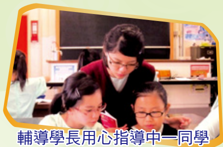
輔導學長用心指導中一同學