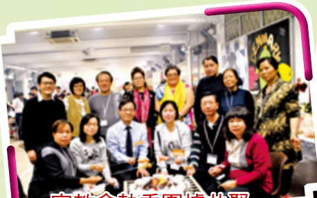
家教會執委圍爐共聚， 樂也融融