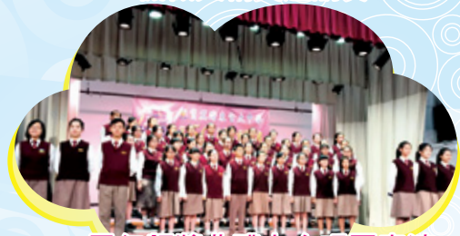
周年頒獎典禮上合唱團表演