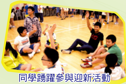
同學踴躍參與迎新活動