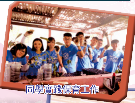
同學實踐保育工作