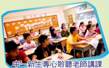
中一新生專心聆聽老師講課

為協助中一新生融入學校，本校於暑假舉行中一新生迎新暑期活動及訓練課程，向同學介紹學校設施及多姿多采的校園生活。另外，學校亦為同學舉辦學習支援課程，讓他們於開學前熟悉課程內容，盡快適應中學生活。