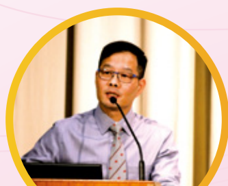
賴校長於開學禮 勉勵同學努力學習

本校創立於1963年，屬全日制官立男女中學。最初命名為筲箕灣官立工業中學，標示課程引進實用性工業科目的特色。其後，學校與時並進，不斷更新課程，科目廣泛涵蓋文、理、工、商、資訊科技等多元學科。自1998年9月起，本校易名為筲箕灣東官立中學。