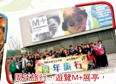
周年旅行，遊覽M+展亭， 共享親子樂