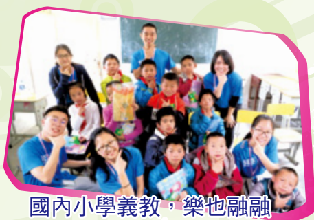
國內小學義教，樂也融融

本校重視建立學生的自信心，提升他們的溝通能力，讓他們學習關愛精神。除了為學生提供個別輔導外，亦舉辦各類活動培育學生成長。