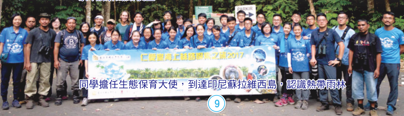
同學擔任生態保育大使，到達印尼蘇拉維西島，認識熱帶雨林