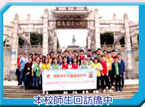
本校師生回訪僑中