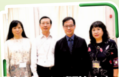
鄧主席(左二)、邱副主席(左一) 賴校長(右二)及甘副校長(右一) 攜手同心，實踐家校合作精神

本校家長教師會成立26年，擔任家長與學校溝通的橋樑，體現家校合作的精神。家教會執委會定期舉行會議，由家長執委與校方執委攜手推展會務。家教會亦招募家長義工，凝聚家長力量，締造更優良的學習環境，讓學生愉快成長。家教會每年舉辦周年會員大會、燒烤晚會、親子旅行、教育講座及興趣班等，讓家長聚首一堂，增進情誼。