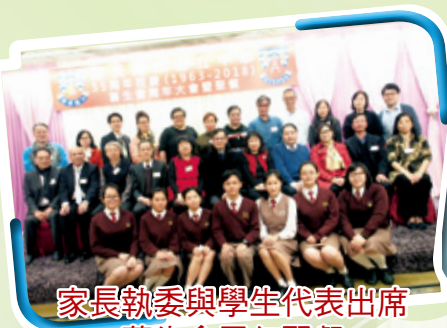
家長執委與學生代表出席 舊生會周年聚餐