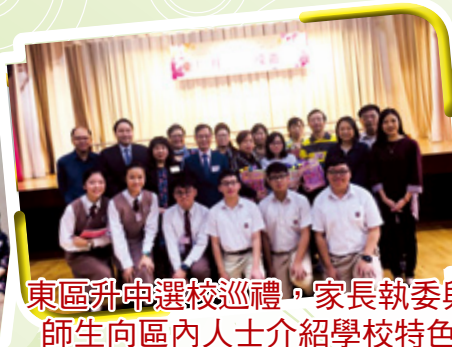
東區升中選校巡禮，家長執委與 師生向區內人士介紹學校特色