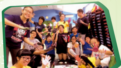
學長與學弟學妹打手印，成立新小組

學校舉辦「大哥哥大姐姐計劃」，讓輔導學長透過活動及溫習小組，陪伴中一同學成長。「成長新動力」則為中二學生而設，教導學生溝通技巧及學習處理情緒的方法。中三至中五學生可參加「義工交流計劃」，與國內中學生交流，到當地小學擔任義務導師、探訪老人院及參與農務工作等。活潑好動的學生可參加「現代舞蹈組」，透過舞蹈建立自信，更在校外贏得不少獎項。