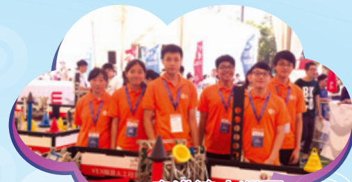
2017粵港澳大灣區 機械人精英邀請賽