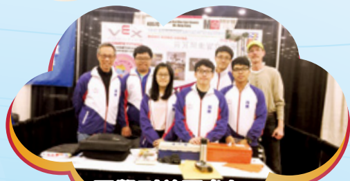
同學到美國參加VEX 機械人世界錦標賽2018

本校資優生培育組培訓學生的領導才能，並發展其多元潛能，設領袖生、輔導學長、校園記者及司儀隊等，培養學生服務學校的精神，推廣學校優良校風。