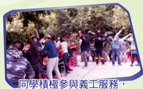
同學積極參與義工服務， 與長者一同做運動