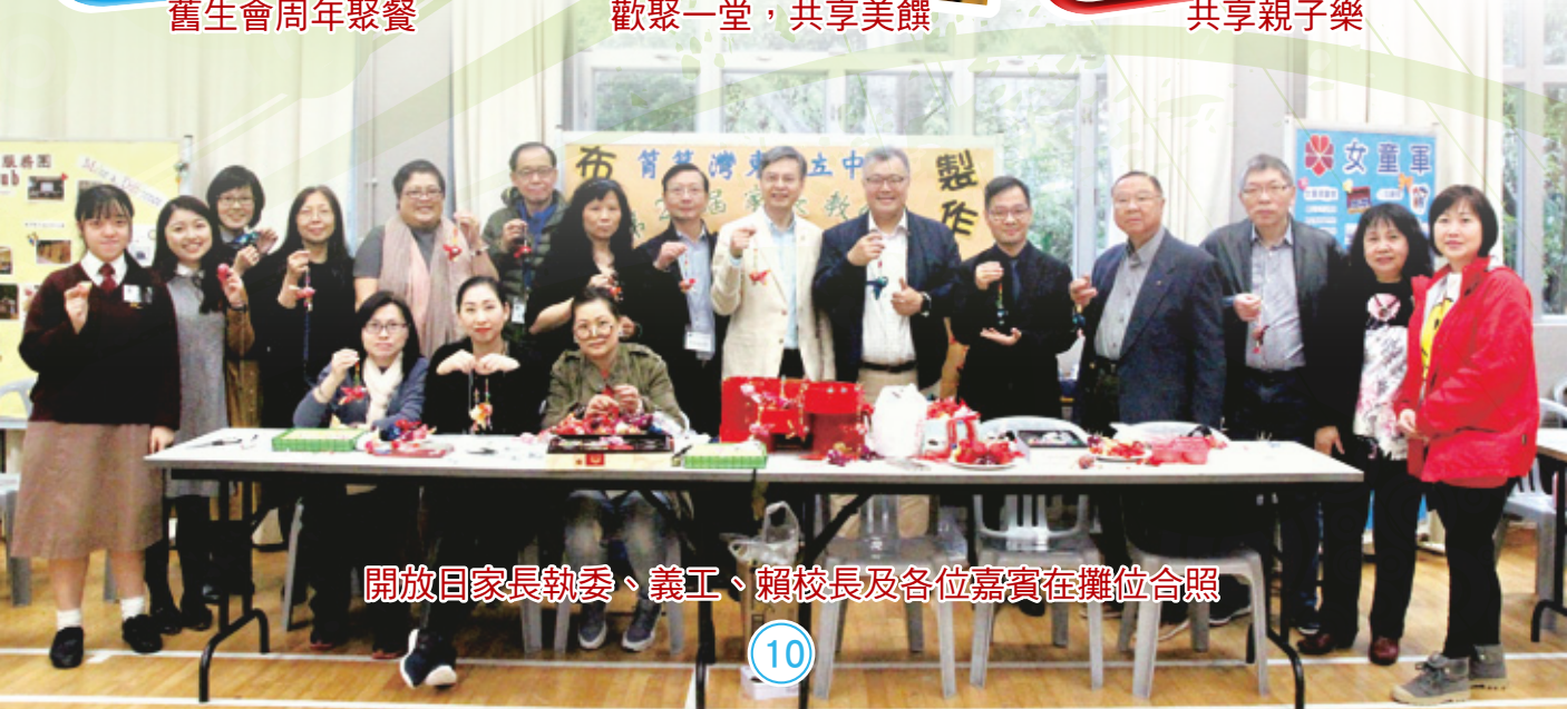
開放日家長執委、義工、賴校長及各位嘉賓在攤位合照