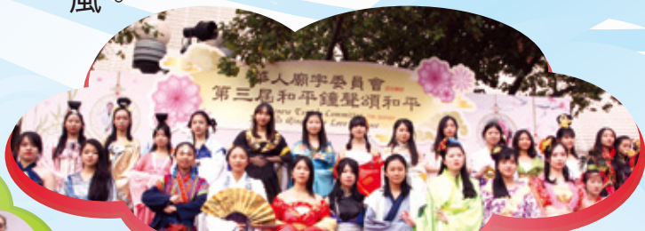
本校學生參與2018國際華服節