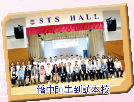
僑中師生到訪本校

本校為香港北區扶輪社「與校同行」計劃成員，亦與循道愛華村服務中心及獅子會等機構合作，安排多元化的領袖訓練、社區服務及生涯規劃活動，並培訓同學擔任蝴蝶大使與生態保育大使，擴展學習領域，培育未來的社群領袖。