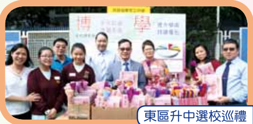
東區升中選校巡禮