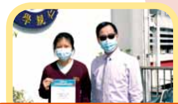
香港島傑出學生選舉 (初中組)