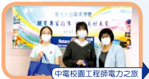
中電校園工程師電力之旅