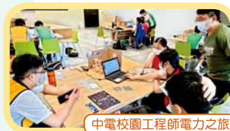
中電校園工程師電力之旅