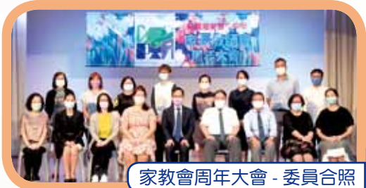
家教會周年大會 - 委員合照