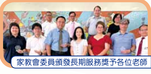
家教會委員頒發長期服務獎予各位老師