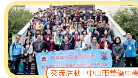
交流活動 - 中山市華僑中學