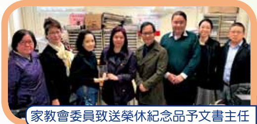
家教會委員致送榮休紀念品予文書主任