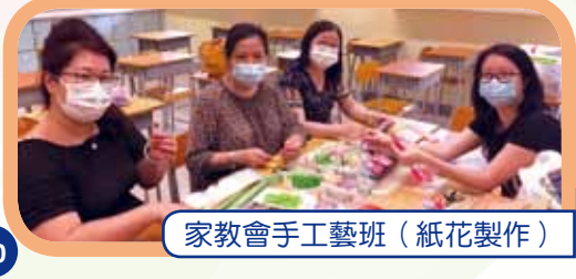
家教會手工藝班 (紙花製作)