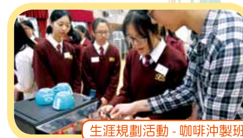
生涯規劃活動 - 咖啡沖製班