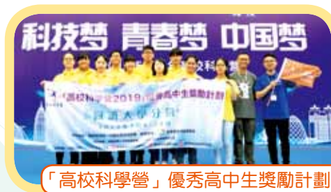
「高校科學營」優秀高中生獎勵計劃

本校致力推動學生發揮個人潛能，活出明確及具意義的人生，學校定期舉辦校外交流及全方位學習活動，讓學生體驗生活及瞭解社會現況。