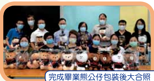
完成畢業熊公仔包裝後大合照

本校家長教師會成立 29 年，擔任家長與學校溝通的橋樑，體現家校合作的精神。家教會執委會定期舉行會議，由家長執委與校方執委攜手推展會務。家教會亦招募家長義工，凝聚家長力量，締造更優良的學習環境，讓學生愉快成長。家教會每年舉辦周年會員大會、燒烤晚會、親子旅行、教育講座及興趣班等，讓家長聚首一堂，增進情誼。