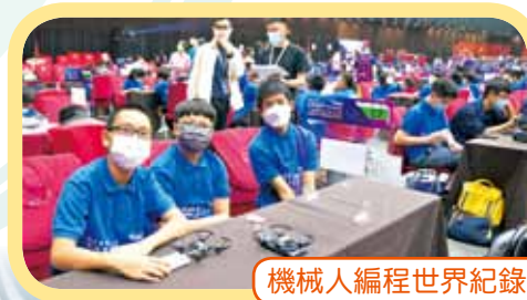
機械人編程世界紀錄