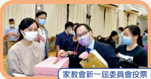
家教會新一屆委員會投票