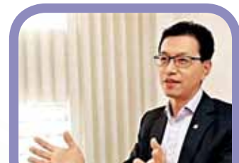
「港區全國人大代表」及工聯會會長吳秋北校友