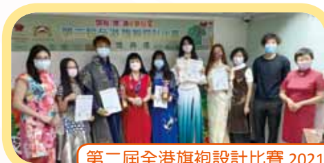
第二屆全港旗袍設計比賽 2021