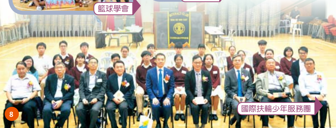
國際扶輪少年服務團