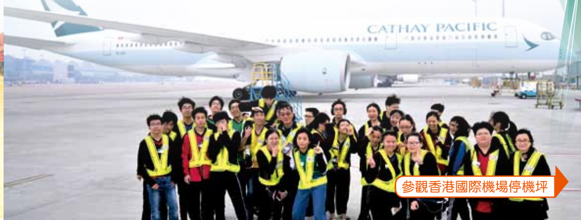
參觀香港國際機場停機坪