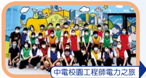
中電校園工程師電力之旅