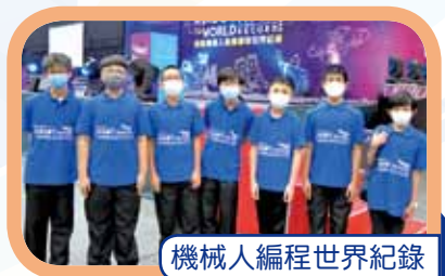
機械人編程世界紀錄