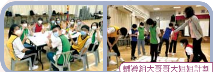
輔導組大哥哥大姐姐計劃

學校舉辦「大哥哥大姐姐計劃」，讓學長透過活動及溫習小組，陪伴中一級同學成長。「成長新動力」則為中二級學生而設，教導學生溝通技巧及學習面對及處理情緒的方法。