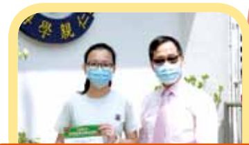
香港島傑出學生選舉 (高中組)