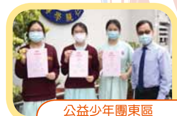
公益少年團東區紀錄片欣賞暨徵文比賽