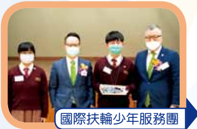
國際扶輪少年服務團

本校學生修讀校本特色課程，不但能學以致用，更在各項比賽中屢獲殊榮。歷年來學生在世界青少年機器人邀請賽、國際華服節、香港工程挑戰賽、時裝設計比賽等，皆獲獎無數，碩果纍纍，有口皆碑。